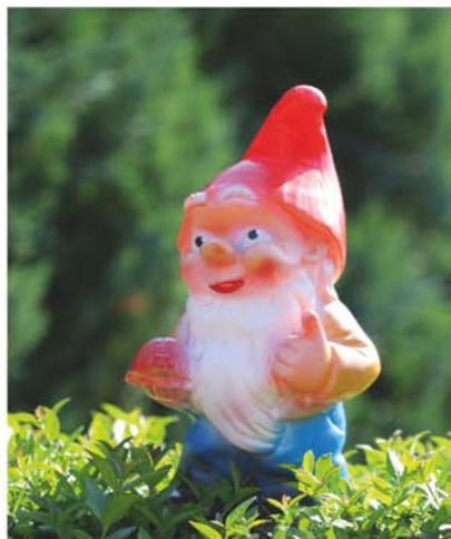
Zipfelmützen-Attacke: Die Zwergenguerilla erobert Brüstungen und Geländer

Auf welcher Seite man bei diesem Blick-Spiel steht, ist letztlich eine Frage des Naturells. Extrovertiert oder kontemplativ – auch das steckt hinter Sehen und Gesehen werden. Stellen Sie sich vor: Ein schönes und